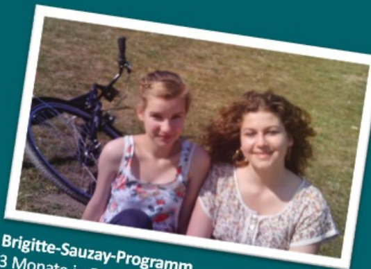
Brigitte-Sauzay-Programm 3 Monate in Deutschland verbringen 2011